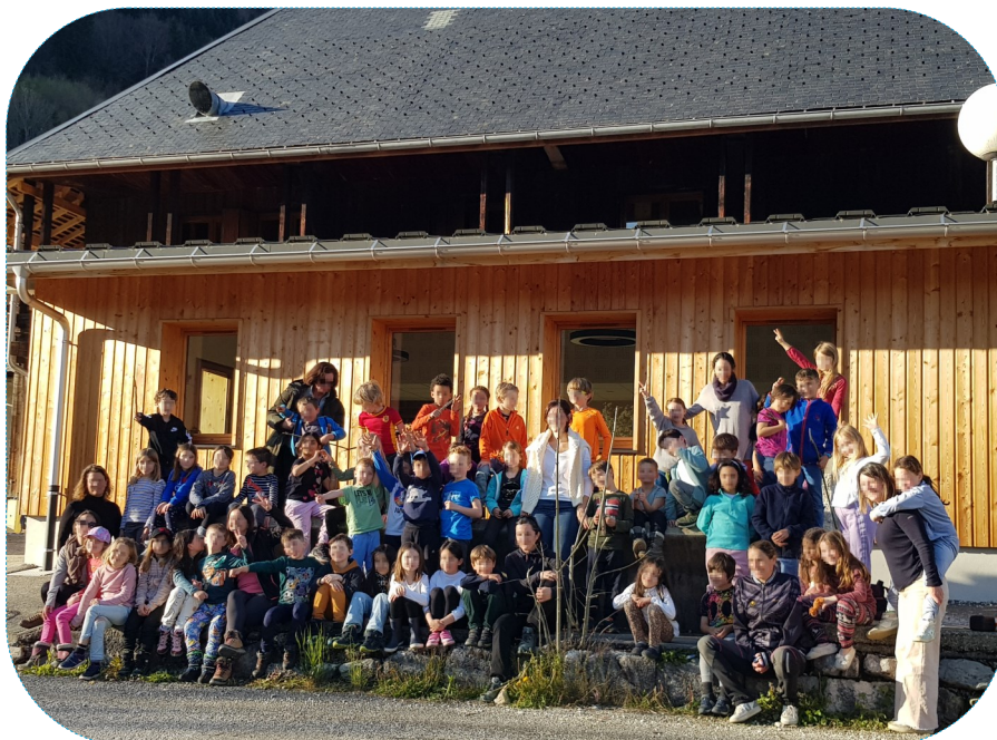
Ecole à la Ferme de la Mense

Vous avez déjà un logement ? Nous sommes autonomes et notre activité est itinérante, nous pouvons venir jusqu'à vous pour vous faire profiter de nos ateliers et mettre des étoiles dans les yeux de vos élèves !